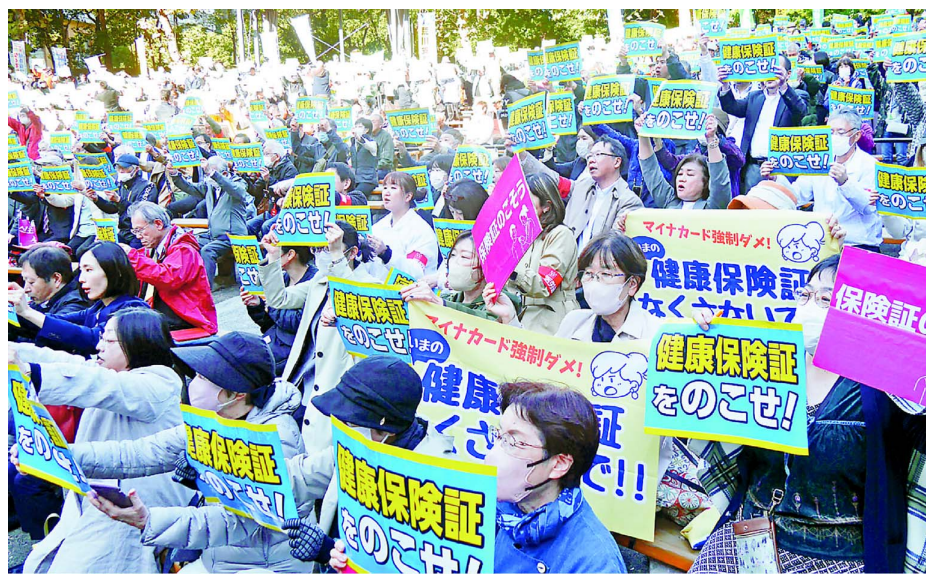
「保険証をのこせ」と、新婦人の会員もかけつけた7日、東京・千代田区

障害者団体の代表は「高齢者や障害者は更新などの手続きを自分で行うことが難しく、支援体制もなく、置き去りにされる」と告発。その後の銀座デモでは、町ゆく人から声援が寄せられるなど反響がひろがりました。