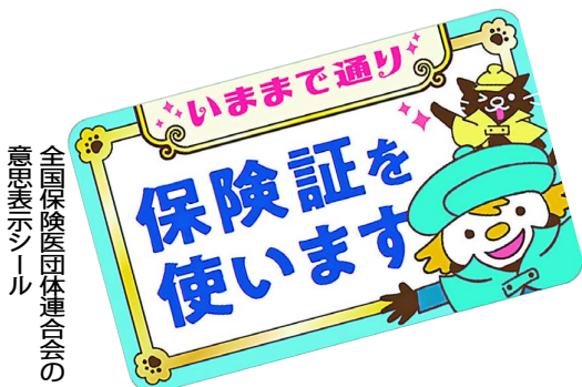
全国保険医団体連合会の意思表示シール

政府は、強引にマイナンバーカード保険証への移行をすすめて、来月12月2日から現行保険証の新規発行をストップしようとしています。マイナ保険証で、「顔認証がうまくいかず、待たされた」「資格確認できず、10割負担を求められた」など、7割の医療機関でさまざまなトラブルがあり、利用率はまだまだ14%を切っています。子育て世代、高齢者、障害者などからも「マイナ保険証強制するな」「現行保険証をのこして」と、実態告発と行動がひろがっています。