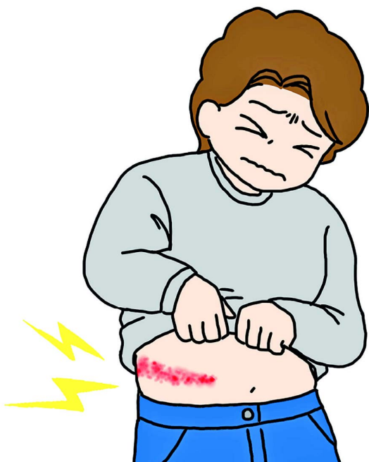
服が触れても痛い